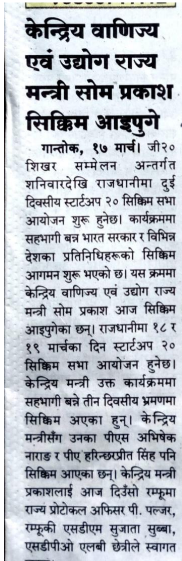
Union Commerce & Industry MoS Som Prakash arrives in Sikkim