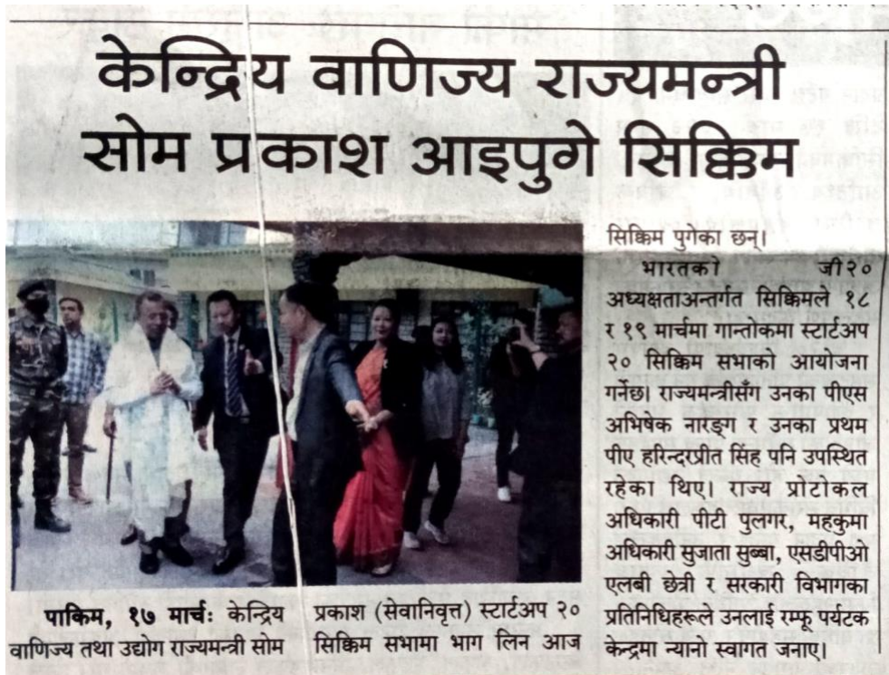
Union MoS for Commerce & Industry Som Prakash arrives in Sikkim