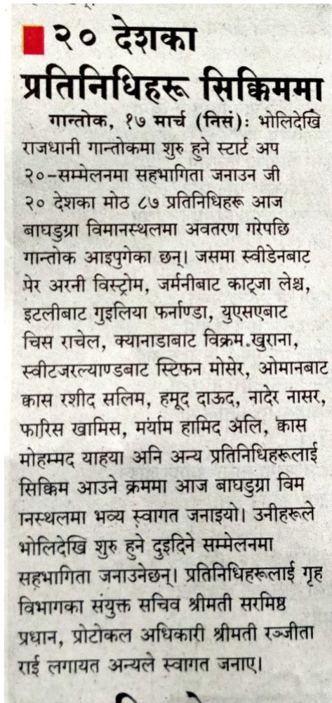
Foreign delegates from 20 nations in Sikkim